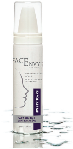
FacEnvy Exfoliant moi